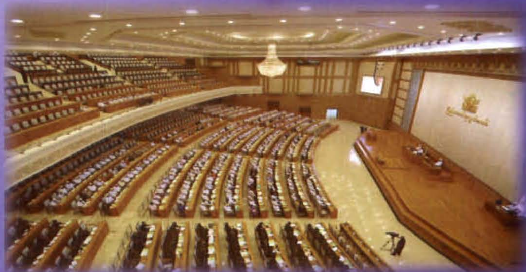
ห้องประชุมรัฐสภาพม่า

กลุ่มงานห้องสมุด สำนักวิชาการ สำนักงานเลขาธิการสภาผู้แทนราษฎร