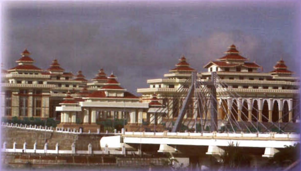
อาคารรัฐสภาพม่า