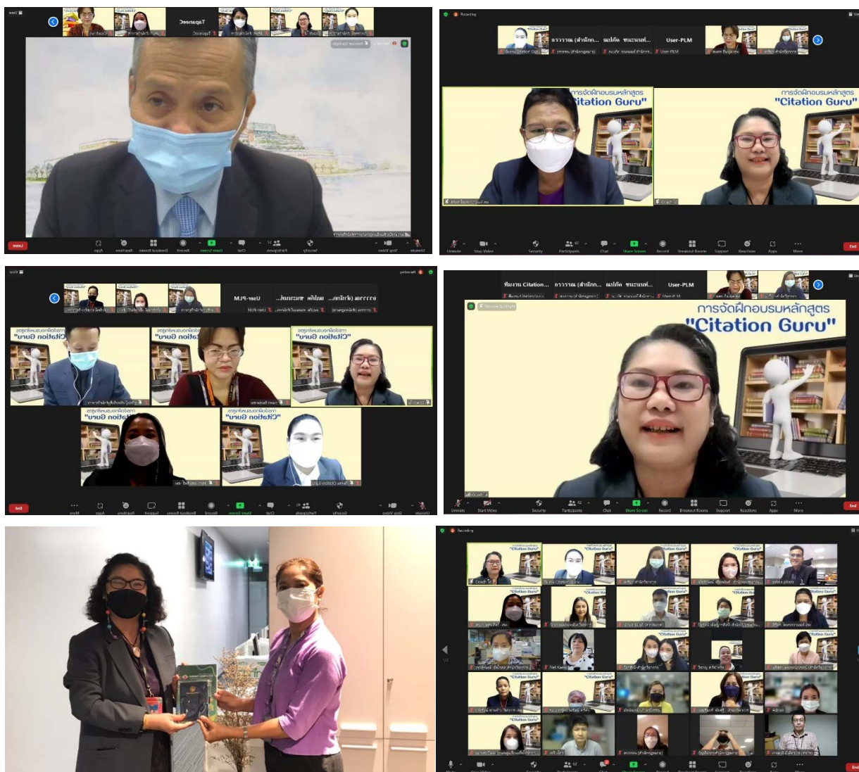
ภาพการจัดกิจกรรมฝึกอบรมหลักสูตร "Citation Guru"

นอกจากนี้คณะผู้จัดยังได้มีการสรุปปัญหาที่เกิดขึ้นในการดำเนินกิจกรรม ทำแบบประเมินตนเองของทีมงาน และแบบประเมินของผู้บังคับบัญชาในกลุ่มงานพัฒนาทรัพยากรสารสนเทศเพื่อนำความคิดเห็นและปัญหาไปปรับปรุงการดำเนินการต่อไป ผลการประเมินตนเองของทีมงาน พบว่าทีมงานทั้งหมดเห็นว่าการเตรียมงาน และการจัดกิจกรรมมีความสำเร็จมากทุกด้าน และทุกคนมีความภูมิใจในกิจกรรมนี้ ในขณะที่ผู้บังคับบัญชากลุ่มงานก็เห็นว่ากิจกรรมนี้ประสบความสำเร็จมากทุกด้าน และภูมิใจในการจัดกิจกรรมนี้เช่นกัน รวมทั้งข้อเสนอแนะว่า ควรติดตามผลความก้าวหน้าของกลุ่ม Citation Guru อย่างต่อเนื่อง เพื่อนำมาต่อยอดเป็น Best Practice ต่อไป